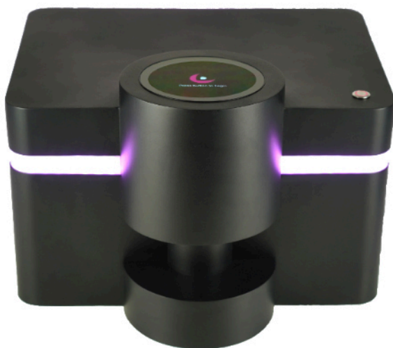
3D Röntgenmikroskop von Histomography